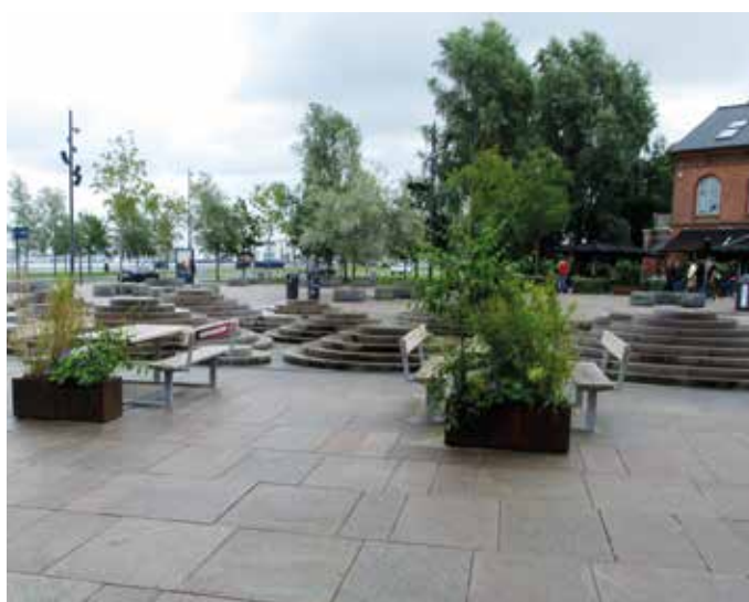
Havnefronten er blevet udstyret med bænke, hvor man kan sidde og nyde vejret og udsigten i hyggeligt selskab. Man kan også hoppe i vandet.