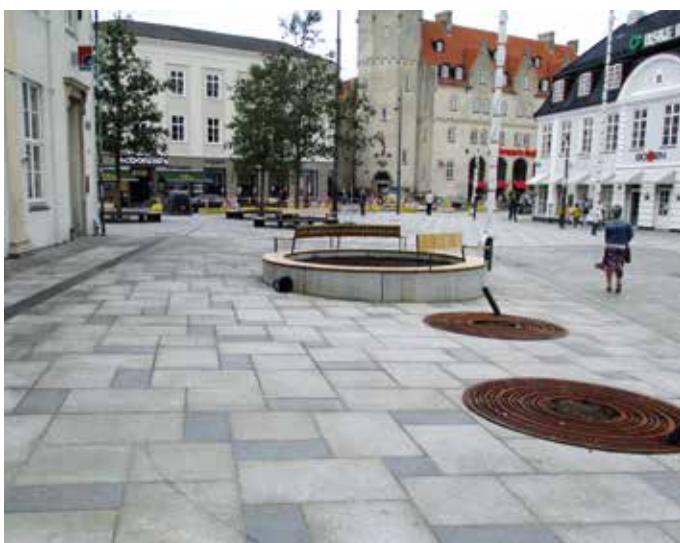
Den nye gågade i Aalborg dækker et større område omkring Salling, Føtex og det gamle posthus.