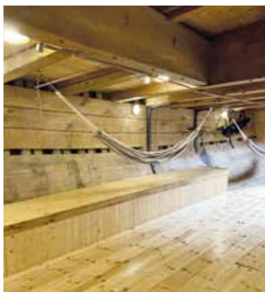
BANJEN hvor GASTERNE (dem, der arbejder på skibet) sover.

Jeg håber, det bliver lige så eventyrligt for dig som for mig!