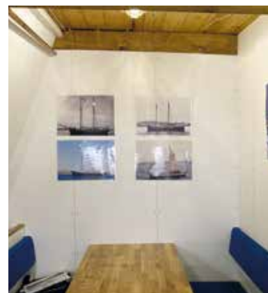
MESSEN er en form for lillebitte spisestue under DÆK (altså nede i skibet, hvor det ikke regner).