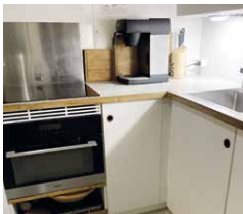
PANTRY er det samme som køkken. Eller spisekøkken. Indeni skibet kan det godt være småt med plads. Det gør bare oplevelsen ekstra hyggelig.