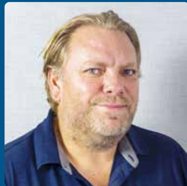
Af Ole Christian Madsen politik-tolk i ULF