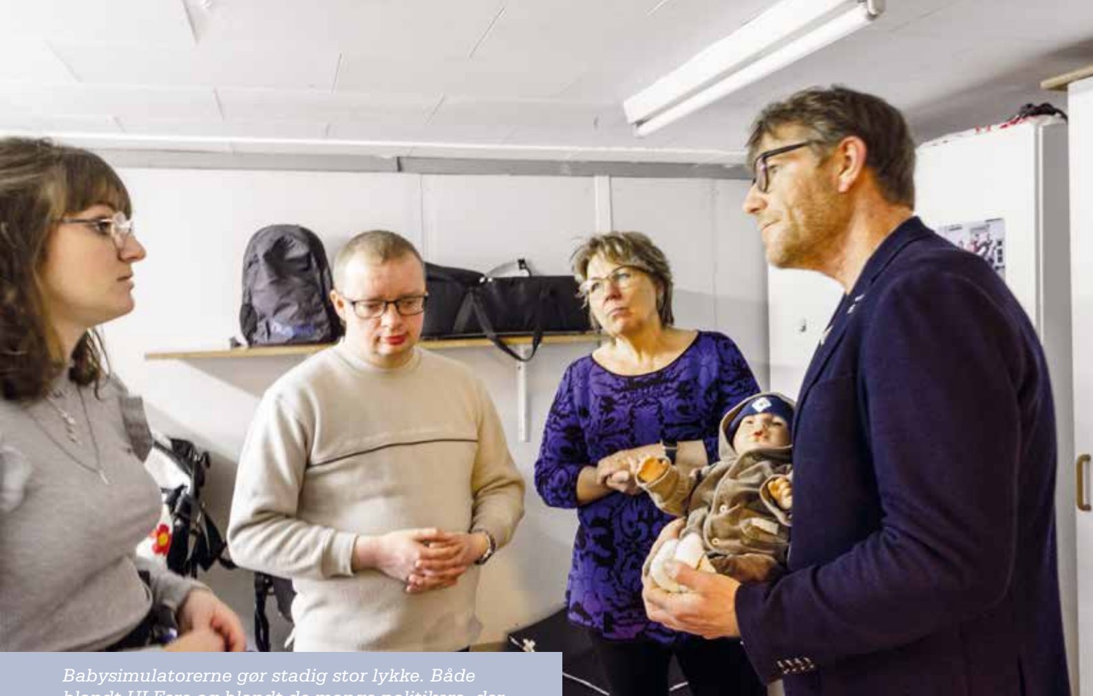
Babysimulatorerne gør stadig stor lykke. Både blandt ULFere og blandt de mange politikere, der de senere år har besøgt hovedkontoret i Vejle.

penge til at købe de første babyer. Vi indlogerede os på et vandrerhjem med en gruppe piger, der skulle afprøve vores babyer.